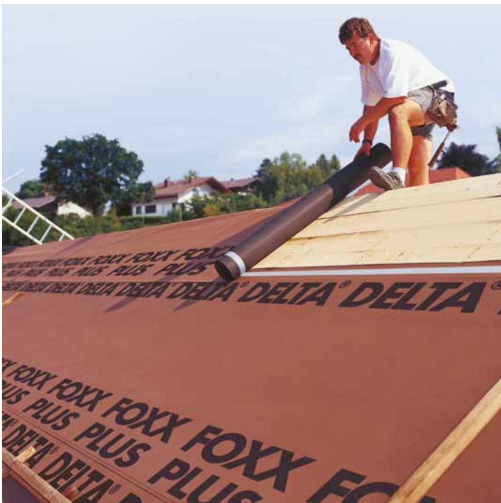
Плётка DELTA®-FOXX PLUS сохраняет вашу мансарду комфортной и сухой на весь срок эксплуатации.