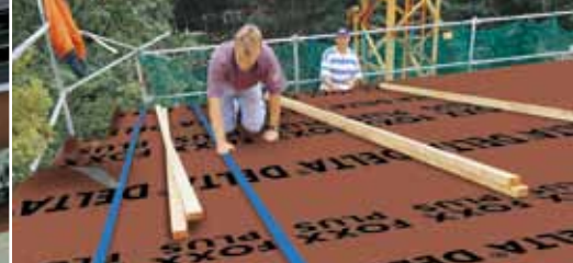
Водонепроницаемость благодаря интегрированным лентам. Уплотнение мансардного окна.