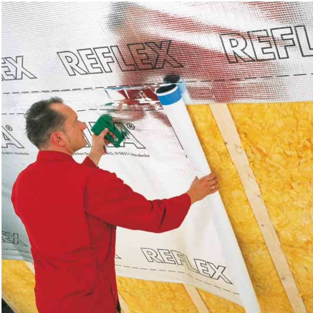
Плёнки DELTA®-REFLEX/REFLEX PLUS являются универсальными пароизоляционными материалами.