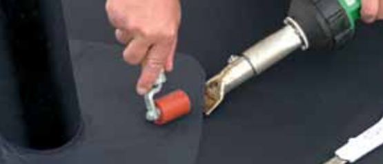
Сварка проходок горячим воздухом.