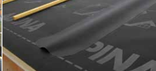
Герметизация контробрешётки лентой DELTA®-ALPINA BAND.