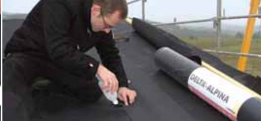
Клей для гомогенного соединения мембраны.