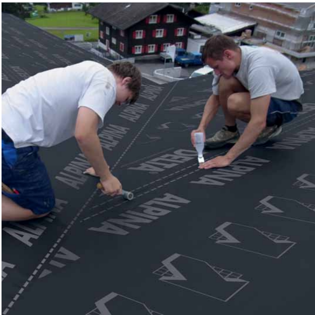
Герметичная проклейка нахлестов DELTA®-ALPINA специальным клеем.