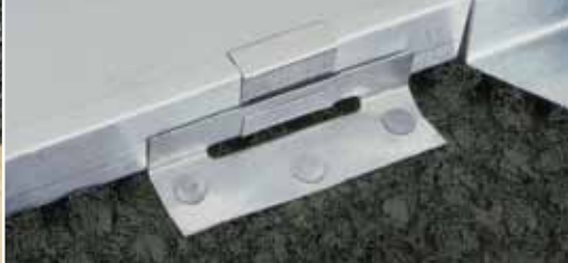
Устранение деформации металла за счёт скольжения