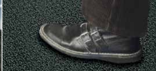
Высокая прочность и безопасность