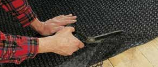
Лёгкая и быстрая установка