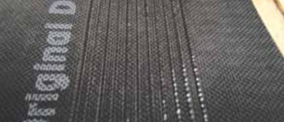
Полная защита от талой воды.