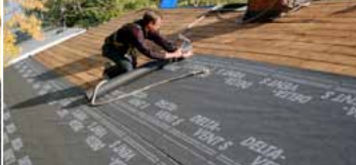
Надёжное применение по сплошному настилу.