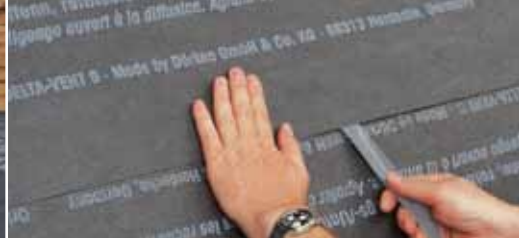
Воздухонепроницаемость благодаря интегрированным лентам.